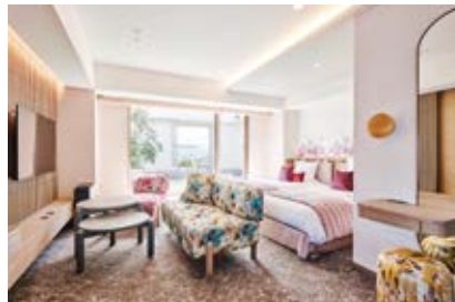
デラックスツインルームからシングルルームまで幅広いお部屋をご用意。お好みのアメニティを自由にチョイスでき、ランドリーも完備した長期滞在型にも対応可能です。