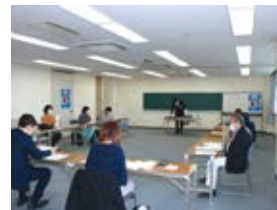
法人税確定申告書の書き方講習会