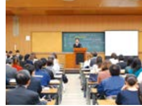
源泉部会実務研修会