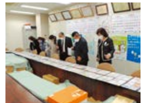
絵はがきコンクール