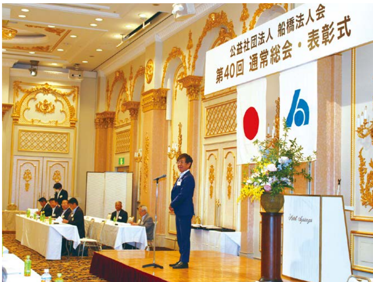
第40回通常総会・表彰式