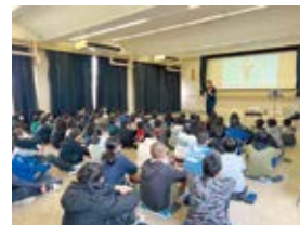
青年部会租税教室