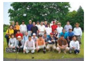
チャリティーゴルフ大会