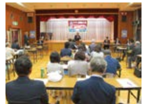
ブロック別研修会