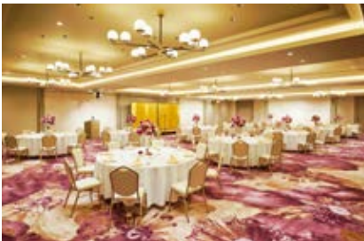
会合、セミナー、展示会と、さまざまなシーンでの対応が可能な7つの宴会場をご用意。メインバンケットは200名の着席もでき、リモート会議も可能な一室も。