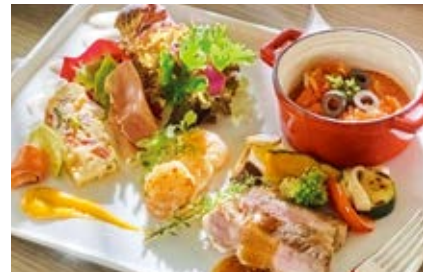
シェフが腕によりをかけた料理を楽しめるレストラン「ブルメリア」。朝食ではハーフブッフェのご案内で組み合わせはご自由に。カフェ・ランチではセットメニューなど多数そろえております。