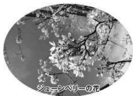
ジュンベリーの花

新しいまちから、長津川調整池に向かって歩いてみましょう。かつては「長太郎団地」そんな呼び方をされていた家並みの街です。2km程を歩いてみると、そこには、かつては「丸い病院」という呼び名の「船橋総合病院」、大きな家電量販店。そして、なによりも心を止めたのは「自転車専用道路」です。自転車で行きかう人々が多いことと時間に制約なく、「マイ・ペース」で行動できる自転車の便利さを実感しました。