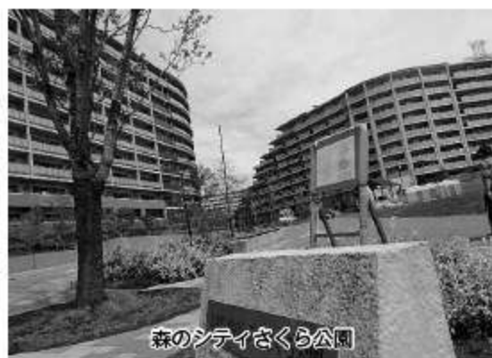
森のシティさくら公園