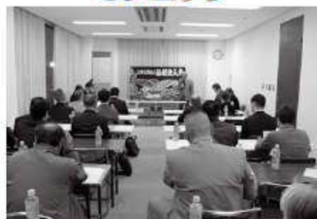
法典公園グラスポにおいて