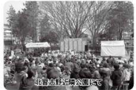
北習志野近隣公園にて

3月12日、「花いっぱいIN習志野台」という東日本大震災復興支援イベントが開催されました。このイベントは、東日本大震災を風化させないために2011年より続いている北習志野のイベントで、出店での売上の一部や協賛金を集め、東日本大震災で被災された方々へ支援活動を続けています。そこで北習高根支部では、二代目経営者や若手経営者の入会候補者に声を掛け「ニューリーダーズ」と名付け結束を固め、出店させていただきました。内容としては、天候にも恵まれポカポカと暖かく青空の公園に畳25帖を敷、販売したさつま芋スティックと甘酒、ホットワインを飲食できる、ゆったりとしたスペースを提供することができました。この地域の皆様が家族、友人等と昼で団欒している姿を見ることができ、とても温かい気持ちになりました。