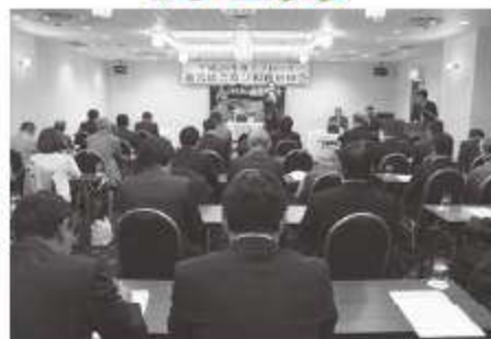
船橋グランドホテルにおいて