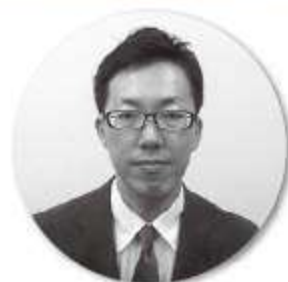
石渡戸法人1審理官