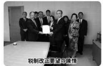
税制改正要望の陳情