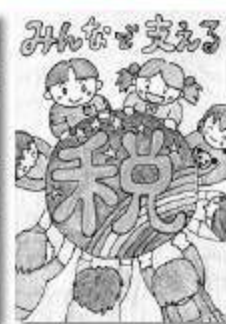
船橋法人会女性部会長賞