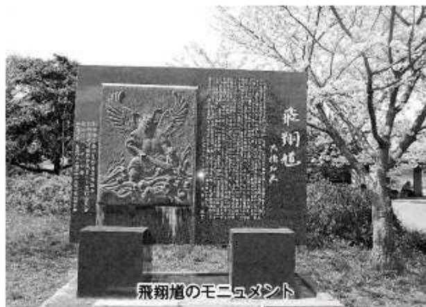
飛翔鳩のモニユメント