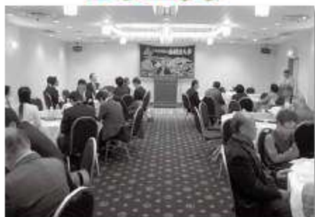
船橋グランドホテルにおいて