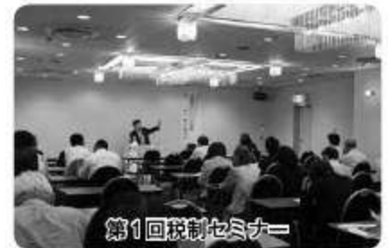
第1回税制セミナー