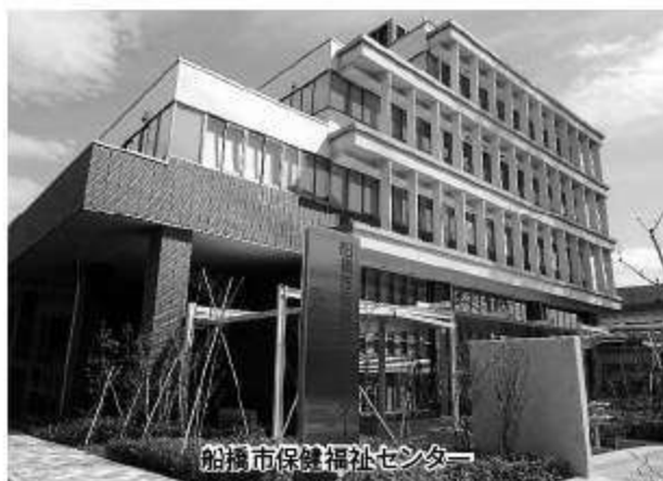
船橋市保健福祉センター