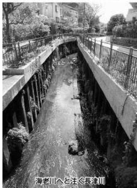
海老川へと注ぐ長津川

調整池の水門を後にして、住宅街を抜け夏見台の山裾を川沿いに歩いてみました。ところどころに公園が設けられていて、そこは憩いの場になっていました。川底までは10m位と深く、大雨でも心配は要らないと思いました。川底には魚の泳ぐ姿もあり、水が徐々に浄化されている様子がみてとれました。車も通らないこの長津川のほつりを歩いて海老川に合流し船橋港へと続くこの道はあまり知られない散歩道でしょう。