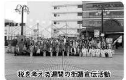
税を考える週間の街頭宣伝活動