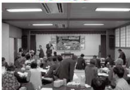
習志野飯店において