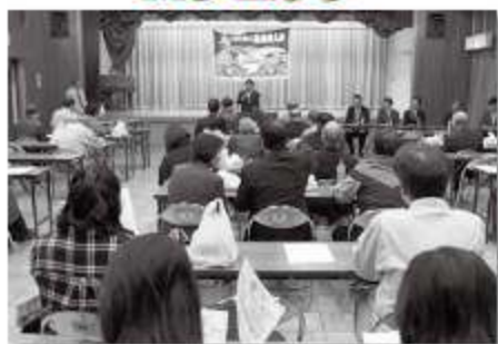
三咲公民館において