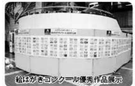
絵はがきコンクール優秀作品展示