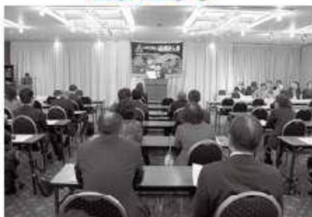
船橋グランドホテルにおいて