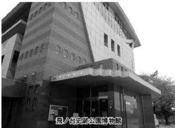
飛ノ台史跡公園博物館