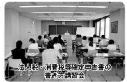
法人税・消費税等確定申告書の書き方講習会