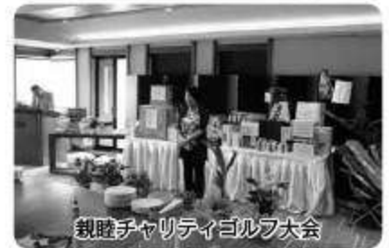
親睦チャリティゴルフ大会