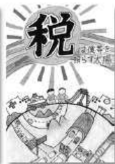
全法連女連協会賞 千葉県法人会連合会賞 千葉県法人会連合会副会長賞