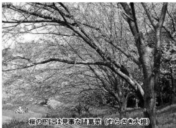
桜の下には見事な請葛菜（むらさき大根）