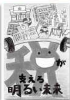
船橋市議会議員賞